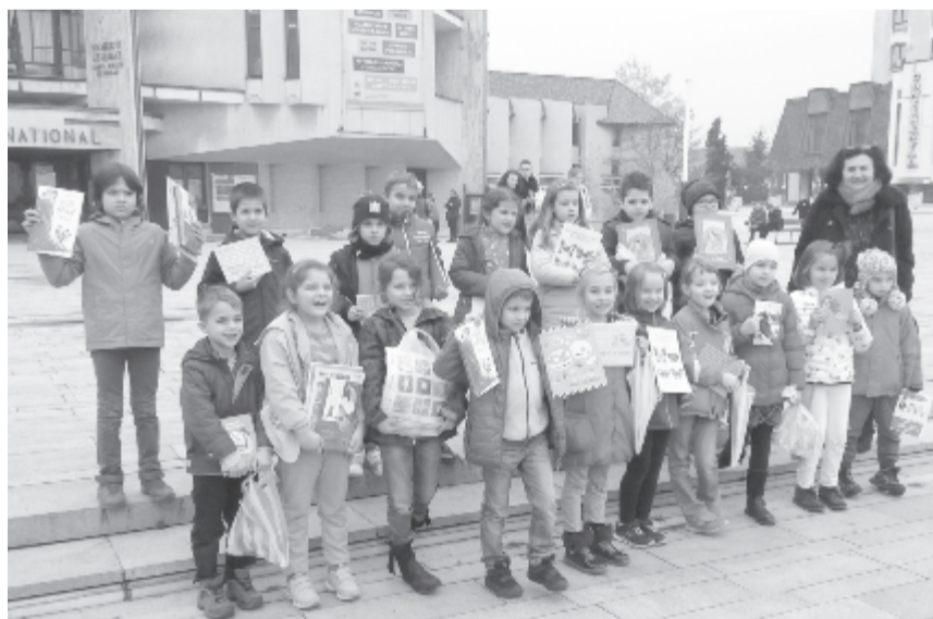
A könyv boldogít... bolyais kisdíjakok vásárfiával